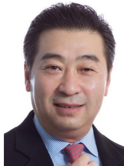
北京大學腫瘤醫院副院長、中國臨床腫瘤學會 (CSCO) 秘書長郭軍教授

黑色素瘤是特瑞普利單抗注射液在國內獲批的第一個適應症，鼻咽癌、尿路上皮癌、非小細胞肺癌、胃癌、食管癌、肝癌等適應症未來也會陸續申請上市。目前，這些適應症正處於臨床研究階段。